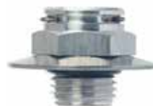
Aluminium-QC mit konischer Unterlegscheibe