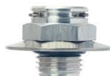
带锥形垫片的铝制快装接头